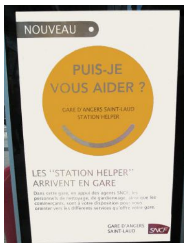
Panneau en gare d'Angers

Une certitude : ne plus utiliser une langue est le premier pas vers sa marginalisation et, à terme, un devenir de langue morte.